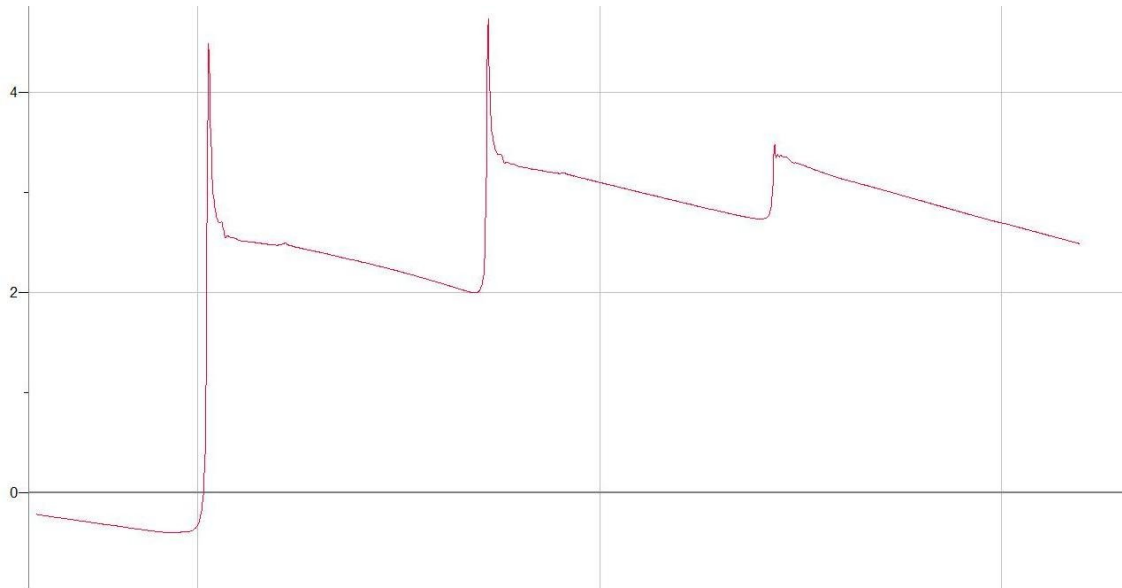
Graf3: Prikazuje meritev absorpcijskih žarkov